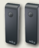
1 paire de photocellules sans fil