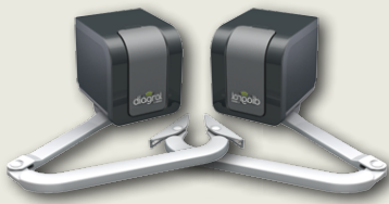
2 moteurs à bras articulés avec centrale de commande intégrée