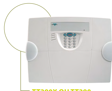
TT390X OU TT390