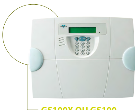
GS100X OU GS100 OU GS110X OU GS110